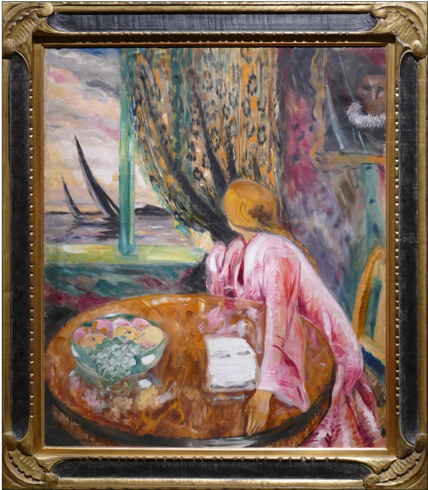
Figur 6: Døden forutsies: Med svarte seil forlater foreldrene sine barn, mens presten ser strengt ned på dem fra veggen.