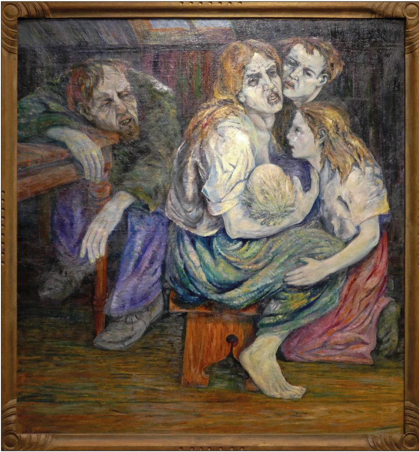
Figur 5: Dobbeltportrett. Til høyre sees kunstneren med kone og barn, til venstre ser vi ham som fordrukkent vrak.