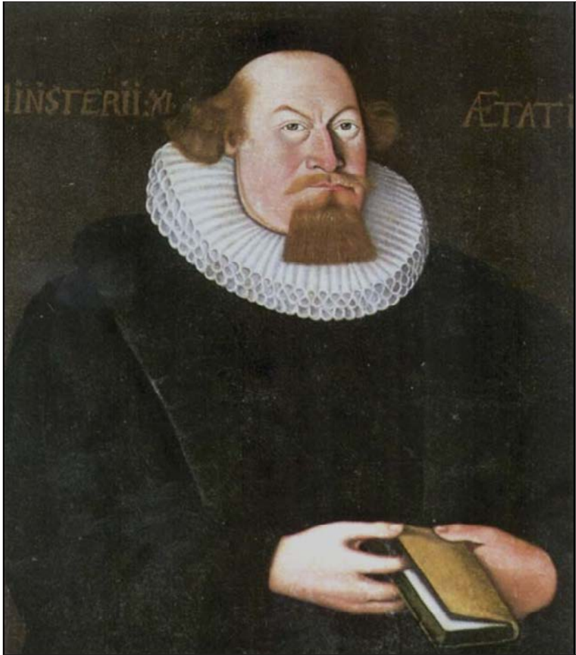
Figur 1. Et portrett i Melhus kirke. Presten er, muligens feilaktig, identifisert som Petter Dass. Uansett illustrerer bildet den myndige framtoning som nok også preget Dass.

Dass tror Satan står bak. Han har flere bevis på at samene har samrøre med djevelen; det har han med «seende Øye fornummet»: