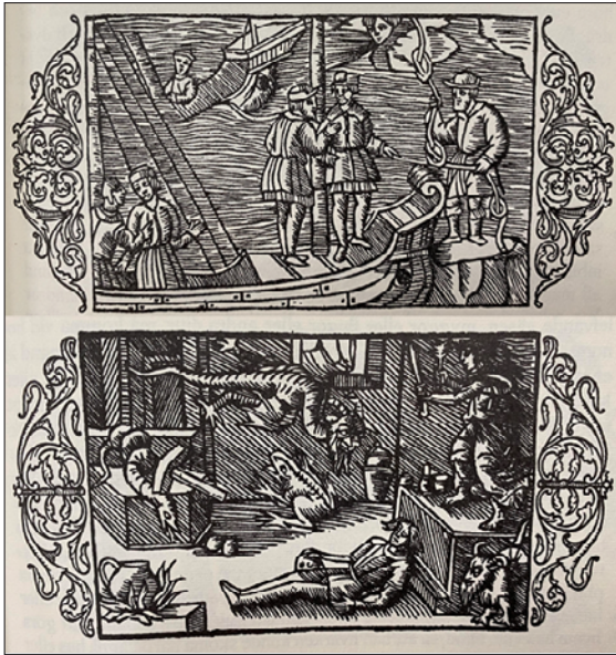
Figur 2. Illustrasjoner av samer fra 1555 hos Olaus Magnus (5). Øverst ses en same som tilbyr sjøfolk et reip med tre knuter. Å løsne knutene innebar å få bør av forskjellig styrke. Nederst: En same ligger i transe med trommen i høyre hånd mens sjelen hans er på reise i fremmede land.

kom til et deilig, stort og lyst rom med mange, mange mennesker. Hun spurte: «Er det dit vi kommer når vi dør?» En annen pasient har beskrevet reiser til stjernene under anfallene sine (10). Denne siste pasientens epilepsi hadde utgangspunkt i overgangen mellom isselapp og tinninglapp, Brodmans area 39 med gyrus angularis. Dette hjernebarkområdet er en del av standardnettverket (default mode network) som står for selv-opplevelsen (11). Elektrisk stimulering av gyrus angularis kan gi en ut-av-kroppen-opplevelse, en følelse av at selvet (sjelen) svever ut av den fysiske kroppen, slik det er rapportert hos epilepsipasienter som gjennomgår slik stimulering før operasjon (12, 13). Narkolepsi er en annen tilstand som med sine drømmeaktige syner i halvvåken tilstand kan minne om noaidens transe. Noaiden kan ha kunnet manipulere de nevronale mekanismene som ligger til grunn for ut-av-kroppen-opplevelser, drømmer og hallusinasjoner. Teknikken har antakelig minnet om selvhypnose. En hypnotisert person kan ignorere omgivelsene, men være intenst konsentrert om den indre opplevelsen som kan framstå svært virkelig. Hypnotiserbarhet (suggererbarhet) er normalfordelt i befolkningen; det vil si at noen få er spesielt suggererbare (14). Blant disse finner vi nok noaidene.