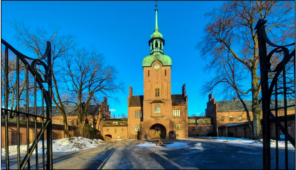
Figur 16.2. Gaustad Asyl ble åpnet i 1855. Tårnet danner enden på en midtakse som går bakover i bildet. Fra aksen strekker det seg ut på begge sider fløyer som ligger bak hverandre. De har forskjellig strenghetsgrad, slik at pasienter kan plasseres og flyttes fram og tilbake slik det passer best med tilstanden. Det var menn og kvinner på hver sin side av midtaksen. Gårdsbruket omkring ble brukt i arbeidsterapien. Anlegget heter nå Gaustad sykehus og er fredet.

Major gikk inn for humane, så vidt mulig tvangsfrie behandlingsmetoder og regnes derfor som en av de største i norsk psykiatri. Han var tiltenkt stillingen som direktør for Gaustad Asyl. Major mente selv at denne oppgaven ville være for stor for ham og han søkte ikke. Han valgte isteden å emigrere til Amerika. I 1854 omkom han og familien da emigrantskipet forliste på vei dit.