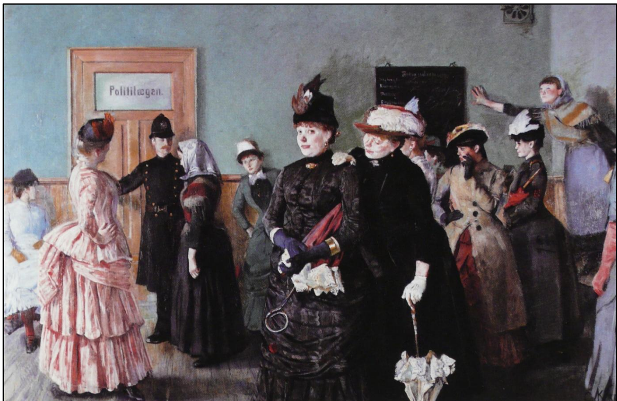
Figur 17.3. Christian Krohgs ikoniske maleri Albertine i politilægens venteværelse (1885-1887) (Nasjonalmuseet, Oslo)

bluferdighet, dyd og moral ikke gjelder lenger, ikke minst i møtet med politilegens visitasjon - før hun lar all skam fare og lar det skure. Krohgs pekefinger er rettet mot fattigdommens og klassesamfunnets konsekvenser.