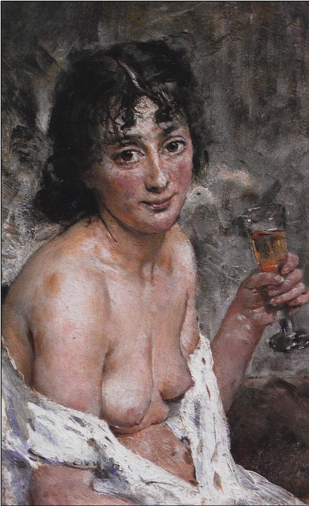
Figur 18.1. Hans Heyerdahl Champagnepiken (1880-1881)