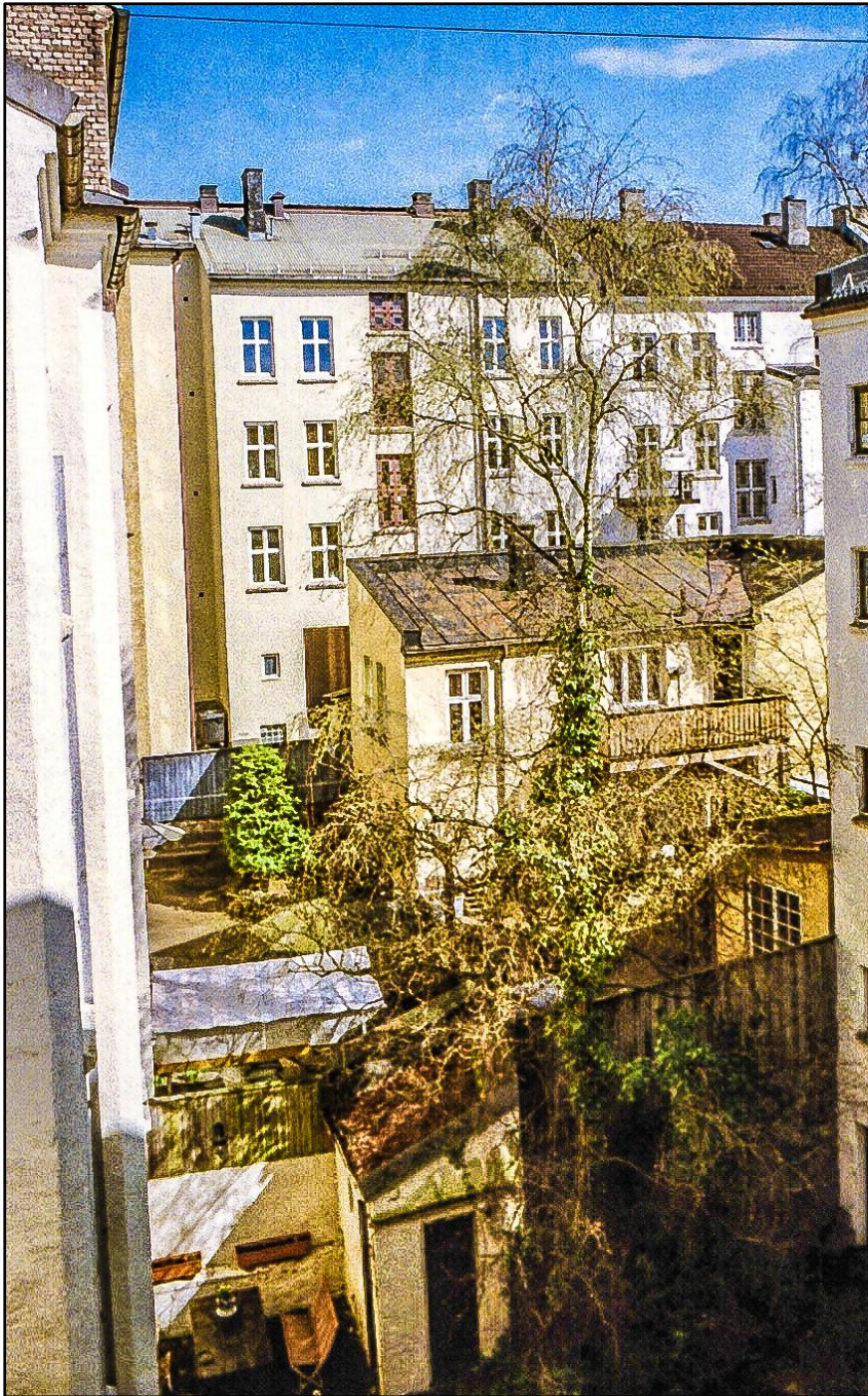
Figur 24.8. Typisk indre av et 1890-års-kvartal i Kristiania, her fra nederst i Sofies gate. Hjørnegården, der bildet er tatt fra kjøkkenvinduet i en tre værelses leilighet i fjerde etasje, hadde også en sideoppgang med seks små to værelses leiligheter. Hovedoppgangen hadde bottetoaletter i oppgangen, mens avtrede for sideoppgangen var det lille huset nederst i bildet. WC ble lagt inn i 1946 og bad senere. Leiegården helt bakerst til høyre har "do-tårn" med toaletter utenfor trappeoppgangen. Nabogården som vi ser litt av nærmest til høyre, var bygd for et annet marked. Den besto av fire herskkelige leiligheter med en tjenerfløy bakover som vi skimter i høyre bildekant. Bygningen midt inne i kvartalet har huset forskjellige håndverksbedrifter.