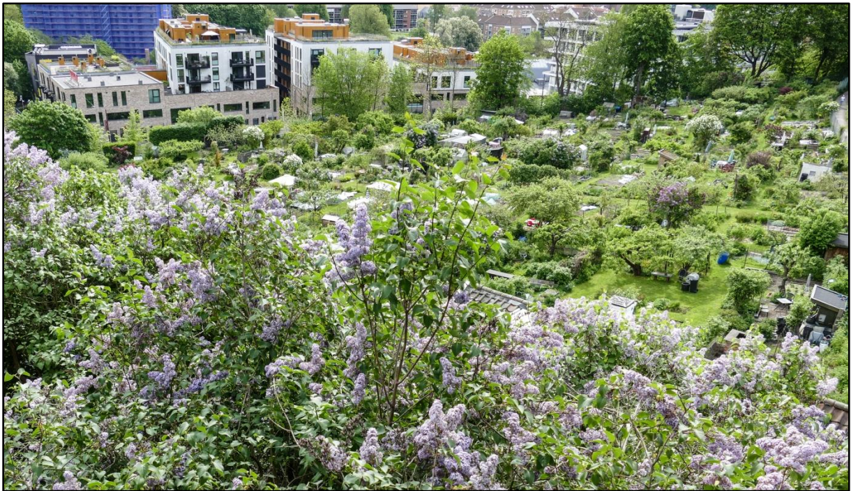
Figur 24.12. Kolonihager oppsto især i årene rundt 1900 i mange byer i hele verden. De er en mellomting mellom Oldenburgs "first places" og "third places" - vakre oaser, men ikke for alle, bare for dem som var tildelt parsell. Her fra kolonihagen ved Telthusbakken i Oslo.

oppgangen du pleide gå, er kanskje den samme, men det er andre føtter som får det til å knirke nå.