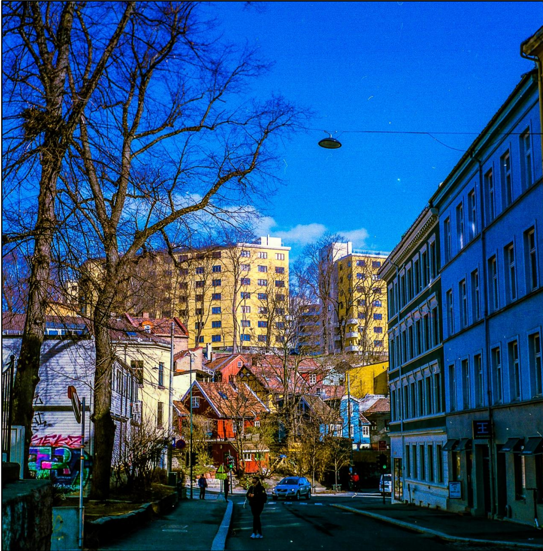
Figur 24.7. Hovedstadens bolighistorie i konsentrat: Fredensborgveien. Midt i bildet sees den gamle forstadsbebyggelsen Bergfjerdningen fra 1700-og 1800-tallet, først innlemmet i Christiania i 1859. Her var det overbefolkning og fattigdom. På 2000-tallet er det blitt en ettertraktet idyll, her under skrenten mellom Damstredet og Fredensborgveien. Idyllen er vakker, men er egentlig en ahistorisk romantisering. Til venstre i bildet, på hjørnet, sees Dops gate 11, oppført i 1871, en typisk gård med tre etasjer fra den tidlige storutbyggingen i byen. Til høyre to gårder i 1880-1890-stil. De har fire etasjer. Gården til venstre er "finere" enn den til høyre. Ofte var annen og tredje etasje markert på fasaden, for her var det ansett som mest attraktivt å bo. Helt til venstre i bildet skimtes et lite industriområde, der det blant annet har vært pølsemakeri. På toppen av åsryggen ligger høyblokkene i Westye Egebergs gate. De har funksjonalistisk stil, er reist i 1930-1939 og ligger rundt en åttekantet plass.