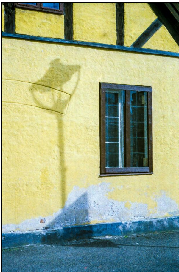
Figur 24.3. Utmurt bindingsverk var typisk Christiania-arkitektur. Eksemplet her er Anatomigården på Christiania torg fra 1640-årene. På bildet sees utmuringen i annen etasje, mens veggene ellers har fått heldekkende murspiss.