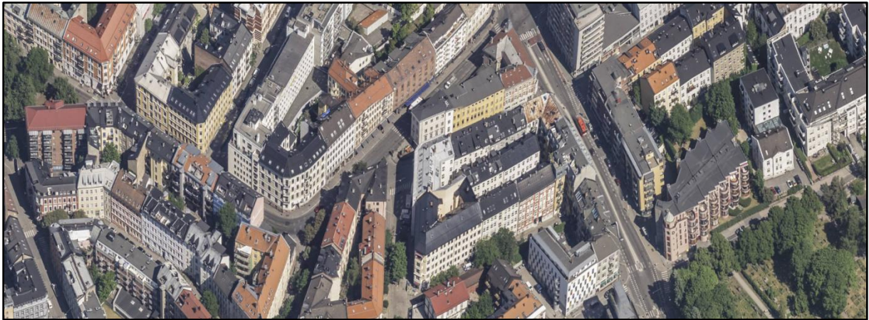
Figur 24.6. Nedenfor St. Hanshaugen i Oslo. Selv i dette "bedre strøk" ble tomtene på 1800-tallet utnyttet maksimalt på bekostning av lys og luft for beboerne. Skikken med å bygge bakgårder inne i gårdsrommene sees midt på bildet til høyre. For de nedre etasjene blir gårdsrommene som mørke sjakter og utsikten fra vinduene rett inn til naboen få meter borte. Til venstre for dette sees et trekantet kvartal der det også er lite lys og luft, selv uten bakgård.

Vannforsyning var fra tidlig av gjerne anlagt med brannberedskap for øye. Dette vannet fylte ikke nødvendigvis de hygieniske kravene den nye tid stilte. Omlegginger måtte til. Brannfaren var imidlertid meget stor i gamle dagers tettbygde strøk. Vann til brannsløkking var det man prioriterte høyest. Årsakene til dette sier seg selv. Ildsteder for ved, kull og koks fantes i alle hus, foruten stearinlys og etter hvert parafinlamper. Slik var det også i årene da Kristiania begynte å vokse, selv om strøm, i det minste nok til belysning, kom i 1890-årene. Christiania Elektricitetsværk ble etablert i 1892 og Hammeren kraftverk i Maridalen i 1900.