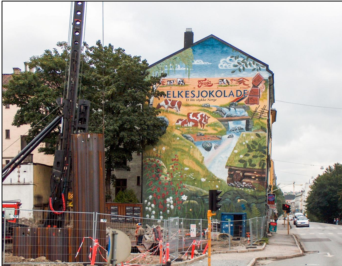
Figur 24.13. "Third places" – men for hvem? Gavler, løkker og mer eller mindre utilgjengelige byggeplasser utgjorde lekemiljø for barn i indre Oslos vekstfase. Her tettes et av de siste hull i fasaderekken ved Alexander Kiellands plass i Oslo i 2004. Byenes ubebygde tomter var "et lite stykke Norge" som nå stort sett er borte.