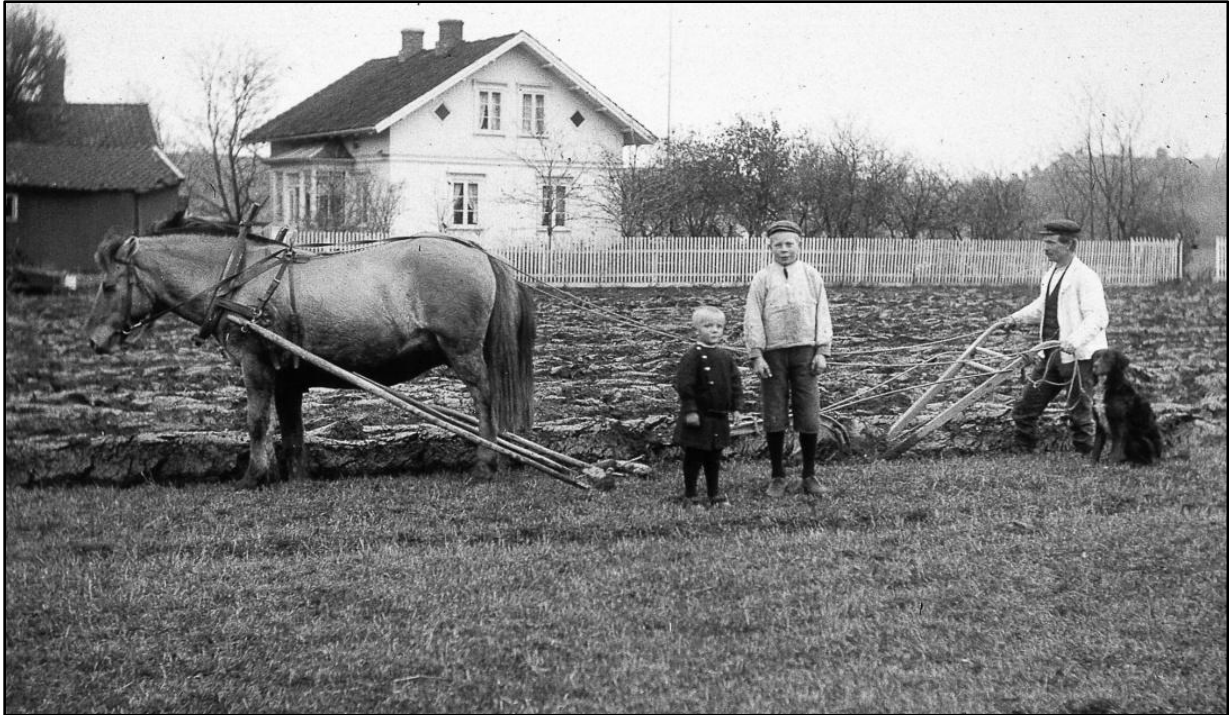
Figur 24.14. "Semiurbanisering" i vekstområde. Deltidsjordbruk i Østfold 1914. Legg merke til at det er to hester på bildet. Bruket holdt seg aldri med mer enn én hest, men her er det to hester som drar plogen gjennom stiv leirjord. Forklaringen er sannsynligvis at den ene hesten var naboens – sammen med naboen drev far i huset nemlig stedets staselige likvogn som ble kjørt med to hester.