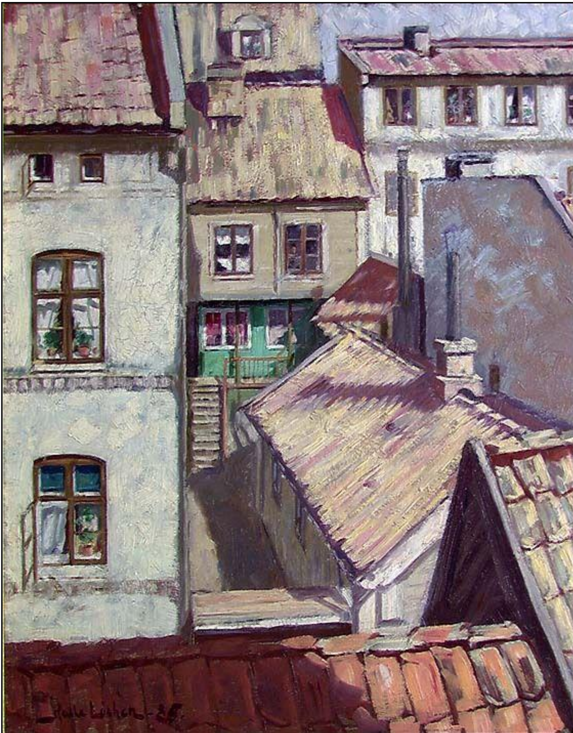
Figur 24.1. Kalle Løchen (1865-1893): Hustak. (1885). (Nasjonalmuseet.)

uhygieniske, kalde og trekkfulle boliger gir dårlig helse. Vi vet også at utformingen av bomiljøer har innflytelse på trivselen, dvs. hvordan miljøet samsvarer med beboernes preferanser, følelse av trygghet, mestring og andre mer udefinerbare forhold som sammen virker inn på hvordan vi trives . For folkehelsen i Norge var