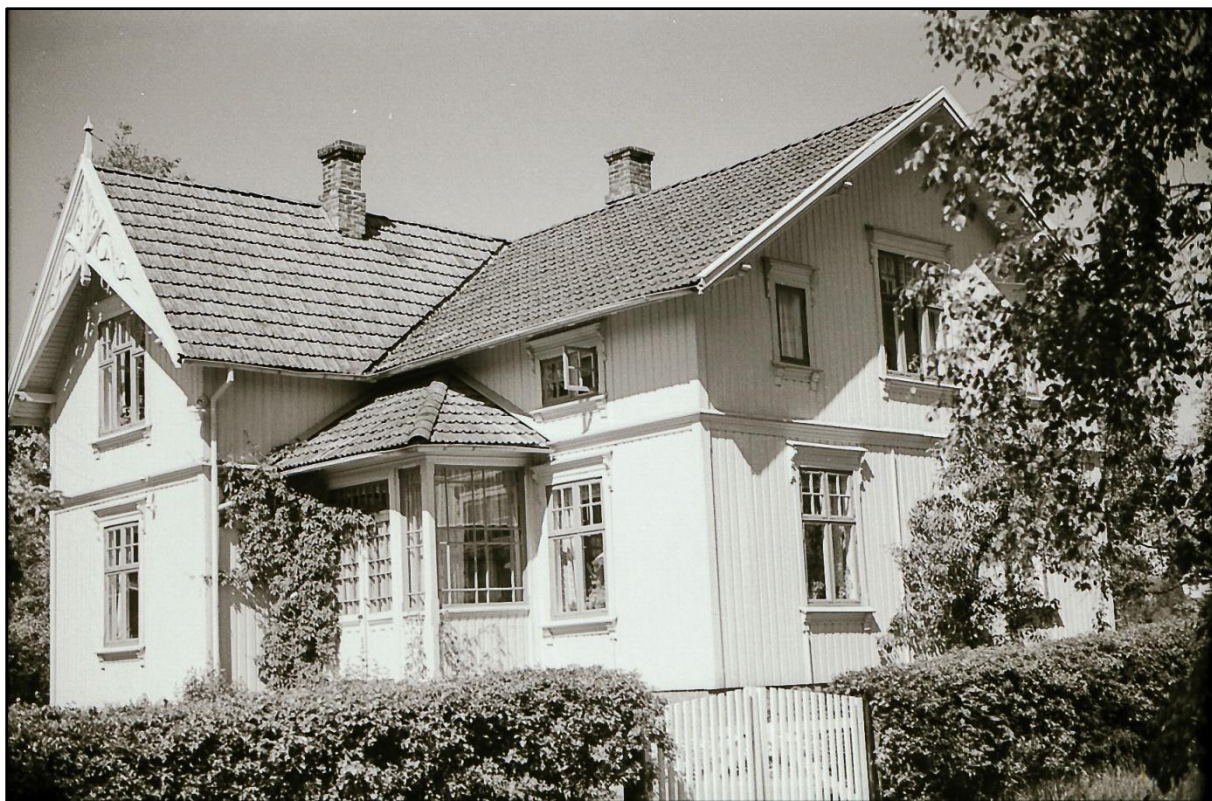
Figur 24.9. Typisk sveitserhus fra årene rundt århundreskiftet 1900. Dette huset er fra stasjonsbyen i Rakkestad ved Østfoldbanens østre linje og bygd ca. 1910. Det er nå revet og erstattet med en boligblokk.

ikke snakkes så mye om det. Det er et historisk tema for seg selv. Det gikk flere tiår før boligreisningen kom ordentlig i gang igjen etter katastrofen i 1899.