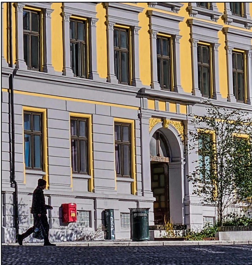
Figur 24.5. 1890-årenes importerte byarkitektur viste seg i ettertiden å ha mange elementer som stemte overens ned basale betingelser for trivsel og helse. Her et eksempel fra Oslo.

Bygårdene som reiste seg, var i den første tiden lave. Tre etasjer var det vanlige. Fra 1880-årene var det imidlertid fire etasjer som ble standarden. Det er de fire etasjes leiegårdene som er blitt typiske for det gamle Kristiania. Gitt løpende tilpasning av disse til behov og standarder, har både historien og senere boligforskning vist at denne arkitekturen i stor grad later til å samsvare med folks preferanser, også over generasjonsgrensene. Det kan ha noe å gjøre med arkitektens estetiske balanse mellom strenghet og mykhet og dimensjoner