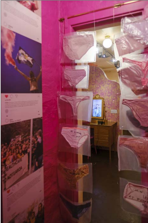
Figur 6. Truser fra aksjonen #1000trusertilErna, montert i aktivismerommet i utstillingen HYSJ! Fortellinger om abort og seksualitet.