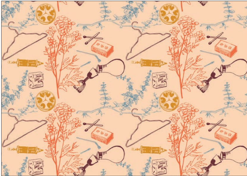
Figur 1. Mønster utviklet til utstillingen HYSJ! Fortellinger om abort og seksualitet. Motivet viser gjenstander brukt som illegale abortmetoder. Til utstillingen ble det produsert tapet med mønsteret som dekket hele vegger. (Illustrasjon: Helene Karlsson, OTALT. © Anno Kvinnemuseet)

fyrstikker, strikkepinner og den giftige urten poleimynte. Alle objektene har til felles å ha blitt brukt som illegale abortmetoder. Dobbeltheten tapetmønsteret kommuniserte var noe prosjektgruppen etterstrebet i utstillingens visuelle profil: Tematikken kunne tidvis være tung og krevende å ta inn over seg, men den skulle presenteres i vakre, fargerike innpakninger.