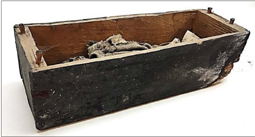
Figur 2. Abortskrin funnet under gulvet i Vinger kirke etter en restaurering på slutten av 1800-tallet. Dette er små skrin brukt til fosterbegravelser. De er del av en landsdekkende rituell skikk, avdekket gjennom kirkerestaureringer.

ble begravet på kristen grunn. Kvinnemuseets abortskrin ble funnet under en restaurering av Vinger kirke og er trolig fra slutten av 1800-tallet.