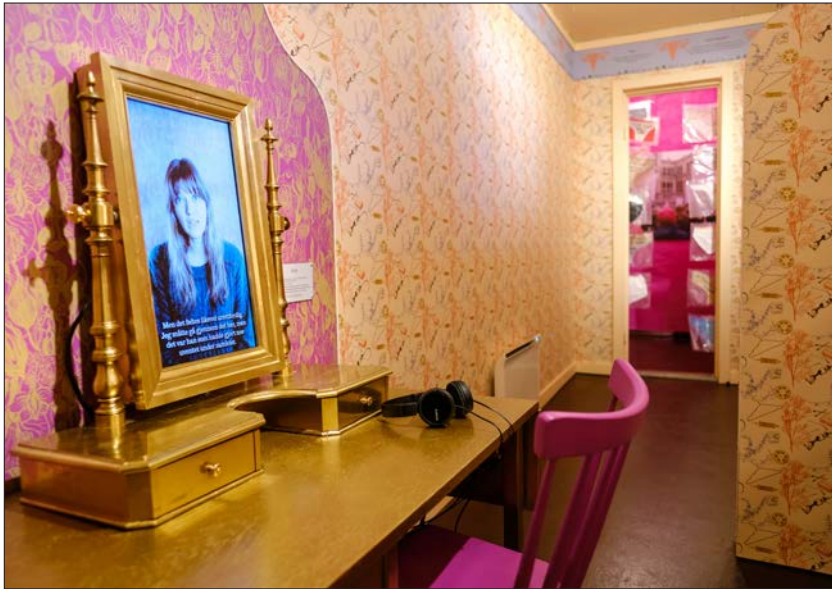
Figur 8. Innsamlede abortfortellinger er anonymisert og blir fremført av skuespillere på skjermer. Fra Fortellingenes rom i utstillingen HYSJ! Fortellinger om abort og seksualitet.

Det andre hovedrommet, Fortellingenes rom , er resultatet av et omfattende internasjonalt innsamlings- og dokumentasjonsprosjekt 5 . Kvinnemuseet mobiliserte nettverket International Association of Women's Museums (IAWM) for å samle inn personlige fortellinger om abort fra hele verden. Alle fortellingene ble anonymisert av hensyn til personvern og kvinnene som ikke ønsket eller kunne avsløre sin identitet. Det ble også samlet inn fortellinger til noen menn. Personene bak fortellingene fikk fiktive navn og ble formidlet på film av skuespillere eller med tegnede ansikter utført av Karlsson i OTALT (figur 8).