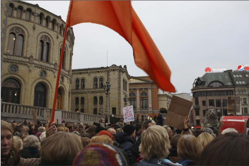
Figur 4. Demonstrasjon utenfor Stortinget, november 2018. Det som utløste demonstrasjonen, var Erna Solbergs utspill om å gå inn for begrensninger i abortloven hvis KrF gikk inn i regjering. Flere av protestplakatene på fotografiet ble samlet inn til Kvinnemuseets utstilling.