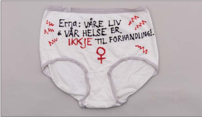
Figur 5. Truse fra aksjonen #1000trusertilErna. Kvinnegruppa Ottar oppfordret kvinner til å sende inn truser med egenkomponerte protester til statsminister Erna Solberg. Kvinnemuseet kontaktet Statsministerens kontor og fikk overta trusesamlingen etter aksjonen var gjennomført.