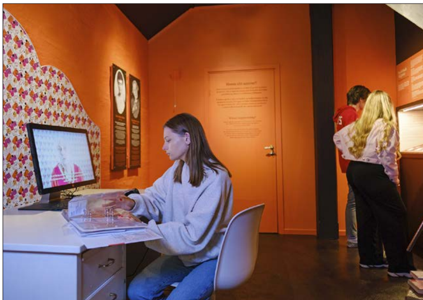
Figur 7. I utstillingsrommet Jordmoras skrivebord kan publikum lære mer om abort fra et helsefaglig perspektiv.