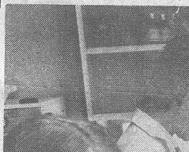
Figur 1: Bergens Tidende rapporterer fra åpningen. Faksimile fra 22. april 1972.

Vi er allerede godt i gang med gruppepraksisen, men tar fremdeles i mot pasienter. Om fjorten dagers tid skulle vi være fullengasjert her, og vi kommer til å gi god og effektiv service. Det er meningen å komme i gang med legeservice fra 8.30 til 18, da sykebesøksformidlingen trer i virksomhet. Ellers vil jeg gjerne ha nevnt at ettersom spesialiseringen stadig fører til mer oppdeling blir det større behov for noen som ser helheten, for allmennpraktikere.