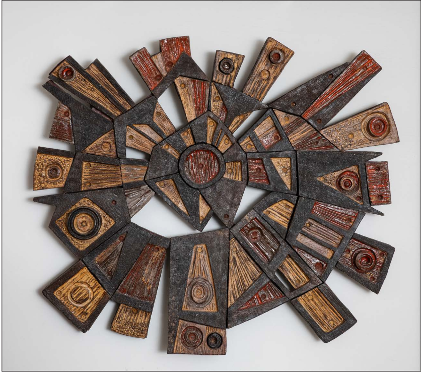
Figur 6. «Sol», keramikkarbeid av Eva Børresen, laget til åpningen av instituttet. Kunstverket hang i legesenterets lokaler. Det ble ikke tatt med ved flyttingen til Kalvarveien, men ble funnet i noe forkommen tilstand stående ute på en balkong i Ulriksdal 8c i 2012. En redningsaksjon ble satt i gang, og kunstverket er sikret for ettertiden.