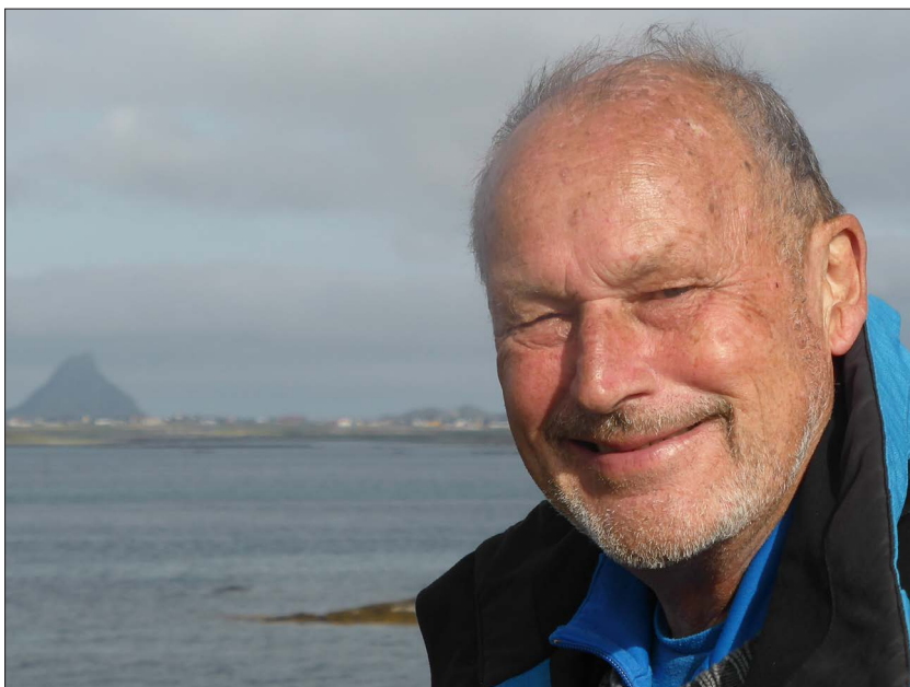
Figur 3: Per Fugelli slik vi kjenner han fra hans siste år. Bildet er tatt på Røst i 2016, der han hadde kjøpt seg hus etter legegjerningen på 1970-tallet. Huset på Røst var yndet feriested, skrivestue og et møtested for familie, venner og faglige kolleger i alle år siden.

medisin, direkte og indirekte gjennom påvirkning av oss som kom etter (figur 3).