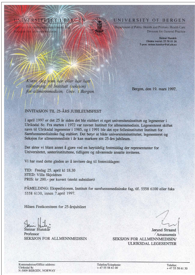
Figur 1: Invitasjon til 25-års jubileumsfest.

samt representanter for fakultetet, Bergen kommune, legeföreningen og andre samarbeidspartnere (figur 1). Festkomiteen besto av Steinar Hunskaar og Jørund Straand. Sistnevnte representerte også Ulriksdal legesenter og var toastmaster under middagen (figur 2).