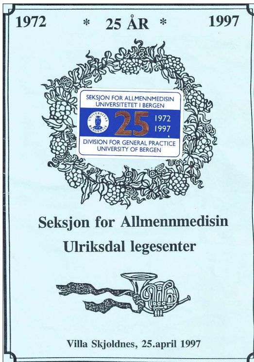
Figur 3: Sangheftet til middagen. Legg merke til den mørkeblå etiketten som er påklistret programmet. I forbindelse med jubileet ble det trykket flere tusen selvklebende slike på ruller. De ble brukt på brev, dokumenter, utstyr og mange andre steder for å markere jubileet.