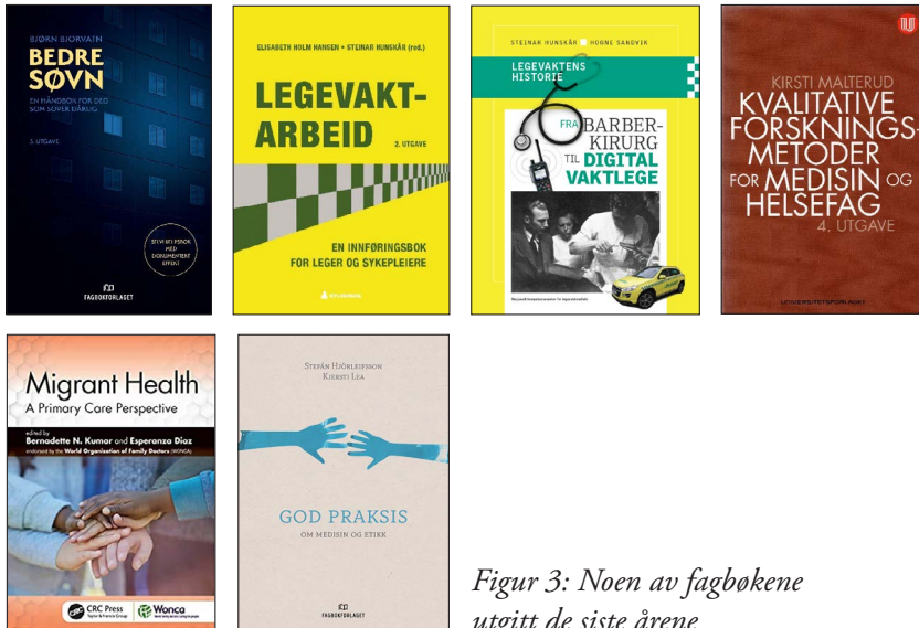
Figur 3: Noen av fagbøkene utgitt de siste årene

Elisabeth Holm Hansen, Steinar Hunskaar. Legevaktarbeid . 2. utg. Oslo: Gyldendal Norsk Forlag, 2020. Andre og reviderte utgave av boken fra 2016. Bjørn Bjorvatn. Bedre søvn. En håndbok for deg som sover dårlig . Bergen: Fagbokforlaget, 2021. Oppdatert og revidert versjon av boken utgitt i 2013.