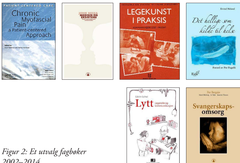
Figur 2: Et utvalg fagbøker 2002–2014

seg mot helsepersonell som jobber med ungdommer med søvnproblemer, men også mot lærere, foreldre og ungdommene selv.