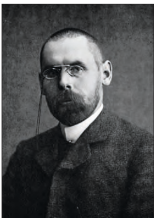
Figur 58: Johan Scharffenberg (1869–1965) fotografert i 1902.