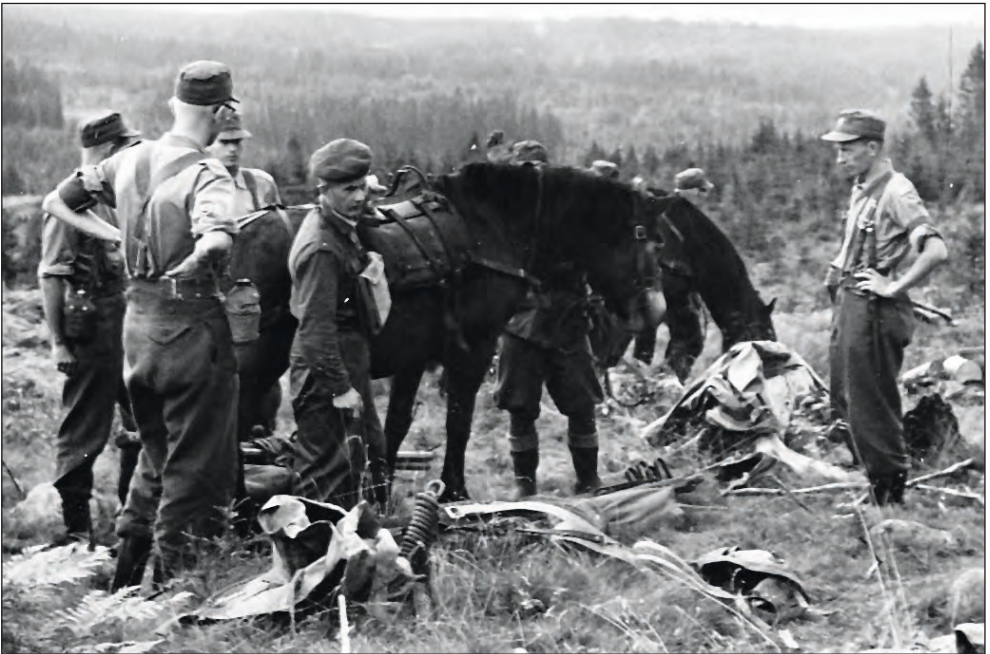
Figur 67: Offiserskurset for medisinerstudenter i 1961 hadde aldeles ikke rideøvelser på programmet, derimot øvelser i å kløve tungt utstyr med hest.