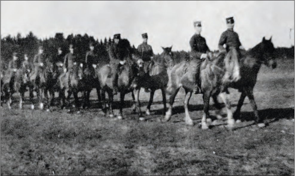
Figur 66: Offiserskurs for medisinerstudenter i 1920-årene inkluderte rideøvelser.