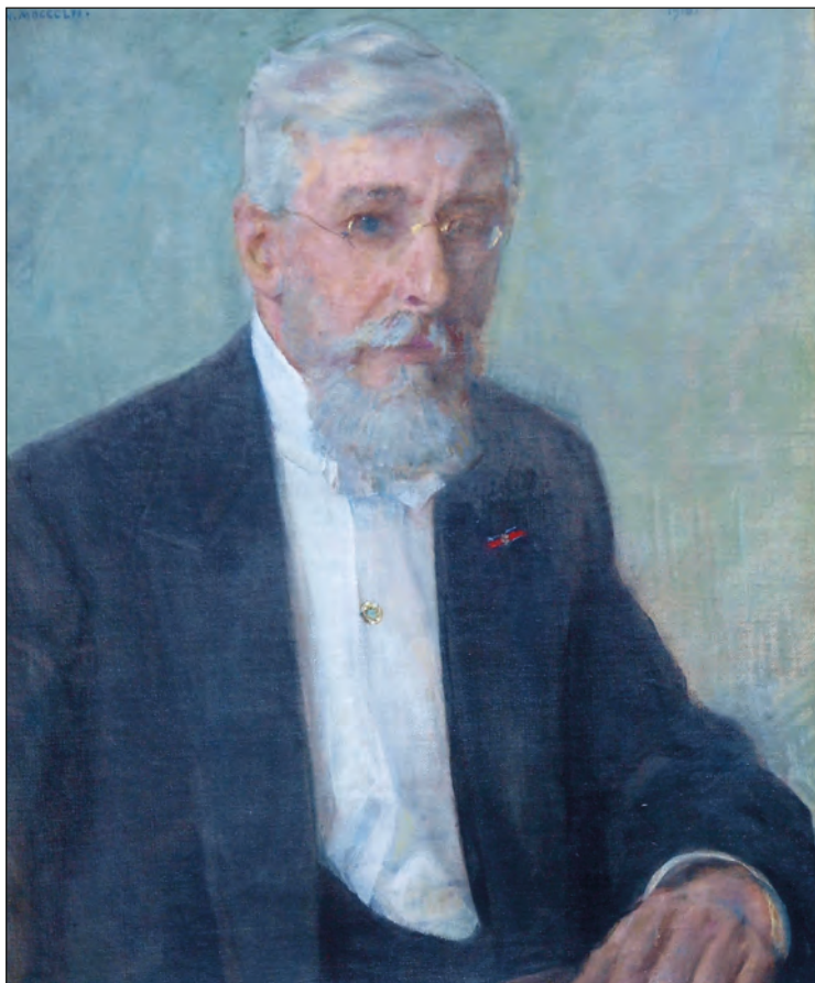
⑥⑩ Emil Ferdinand Rode (1852–1921) malt av Eilif Peterssen (1852–1928)