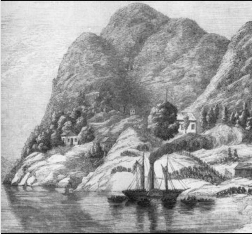
Det første damskipet i Vest-Telemark, hjuldampere "St. Olaf", ved Lårdal brygge i Bandakvatn. Ca 1860. Båttrafikken på de store innsjøene i Telemark innebar en vesentlig forbedring av kommunikasjonene mellom de indre og de ytre distriktene i sommerhalvåret (Østvedt 1959)

over i Vest-Telemark. Av hensyn til tømmertransport, turisttrafikk og annen samferdsel ble så Telemarkskanalen bygget og fullført i 1892, først til Nordsjø og videre til Heddal, og noe senere fra Nordsjø til Dalen. Dette førte også med seg en betydelig veibygging mellom kanalbåtenes anløpsteder og bygdene omkring. På denne måten ble også vesentlige deler av de vestlige fjellbygdene trukket ut av isolasjonen.