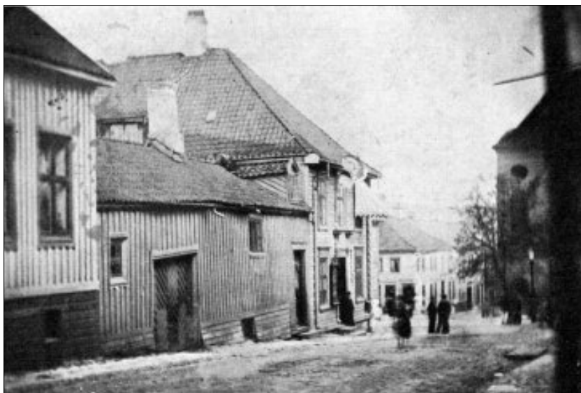
Prinsensgate i Skien ca. 1875. Den store tilstrømningen av arbeidskraft til Skien mot slutten av 1800-tallet skapte store sanitære problemer i de gamle bygdene. De sanitære forholdene gikk gradvis over fra å være et privat til å bli et offentlig ansvar. Selv om kloaknettet ble bygd ut, ble problemene ikke løst tilfredstillende i Skien før etter 1900. (Østvedt 1959)

Gjennom middelalderen og helt fram til nyere tid var Telemark på mange måter et lukket land. Særlig gjaldt dette de øvre bygdene, der det oppsto en kultur med et sterkt særpreg. Telemark skiller seg fra de fleste andre bygdene i Norge ved at der ikke er et hoveddalføre, men derimot mange mindre som deler seg utover som greinene på et tre. Fra mange av disse kunne man i eldre tid bare komme i kontakt med sentrale strøk ved reise over store innsjøer, noe som var særlig problematisk vinterstid. I forbindelse med nasjonalromantikken i første del av 1800-tallet ble Telemark oppdaget av norske landskapsmalere og noe senere av folkeminnesamlere.