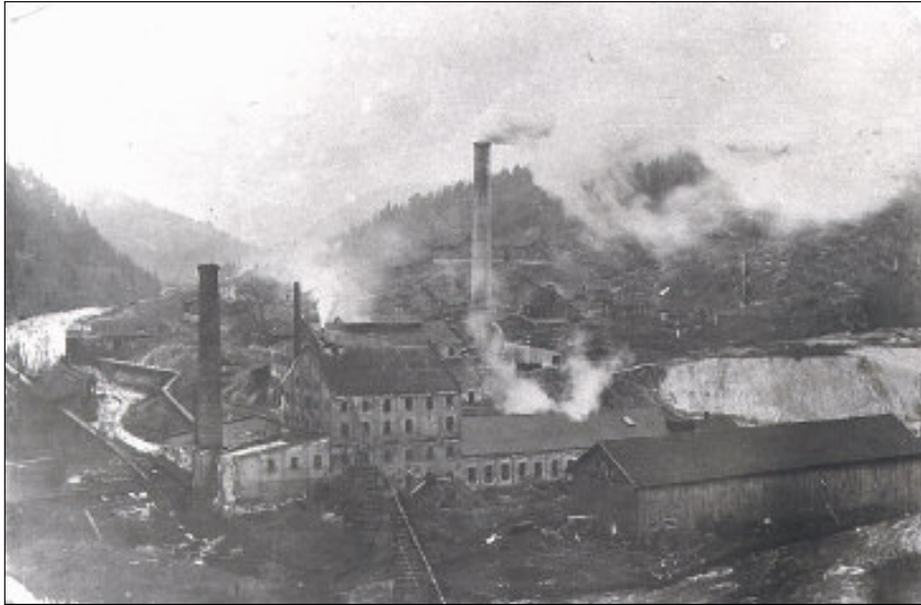
Bamble Aktie Cellulosefabrik på Herre i Bamble var blant de første innen den nye storindustrien som kom i Norge i 1880-årene. Bildet antas å være fra ca. 1897. På grunn av de store luktslippene ble fabrikken dømt i Høyesterett til å stanse produksjonen i 1897, men fortsatt drift ble sikret ved forlik. Saken var vanskelig for Bamble sunnhetskommisjon på grunn av de store samfunnsøkonomiske interessene som lå bak.

Som ellers i kystdistriktene var fiskeri her en viktig næring fra gammel tid. Fiskerne solgte fisken selv, inntil fiskehandlerne tok over. Betydelig eksport foregikk fra Langesund som hadde isfri havn. I 1890-årene kom overgangen til trålfiske etter reker. 14