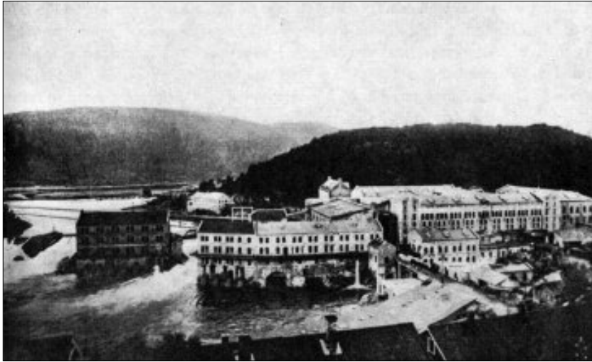
Skotfoss Bruk i Solum herred var en sentral del av den nye treforedlingsindustrien, som kom i Skien-distriktet i 1890-årene. Bildet viser det første anlegget, ca. 1910. (Østvedt 1959)

distriktet hadde økonomisk framgang på tross av nedgangstidene. I 1880-årene kom det også i gang tresliperier i Gjerpen, og her lå også Norges første fabrikk for produksjon av sulfittcellulose på Vadrette anlagt i 1884. I disse årene ble det også startet opp fabrikasjon av teglstein og flere steinbrudd i Gjerpen herred. 19