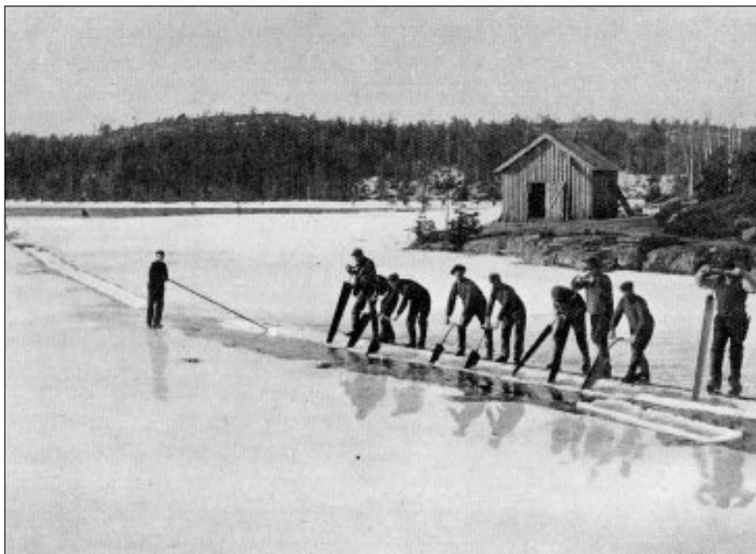
Isskjøring fra Frøvik Tjern ved Kragerø. Iseksport til europeiske land var en viktig næringsvei i de vestlige kystdistriktene i Telemark, særlig etter at trelasteksporten og skipsfarten fikk problemer etter 1880. (Steffens 1916)

Dette gikk spesielt hardt ut over kommunene i Kragerø-distriktet, som i særlig grad var avhengig av trelasthandel, skipsfart og skipsbygging. Tre-