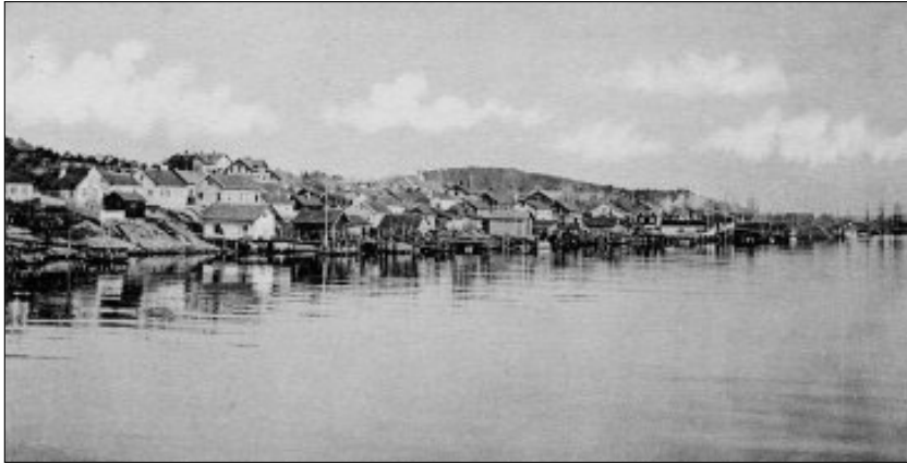
Langesund rundt 1900. Som et lite bysamfunn, der mye av bebyggelsen lå relativt nær sjøkanten, var det lettere for sunnhetskommisjonen å gi huseiere pålegg om sanitære forbedringer. Kloakken ble ført i renner ut sjøen.

Tabell 4 viser utviklingen av aldersfordelingen i legedistriktene gjennom siste del av 1800-tallet.