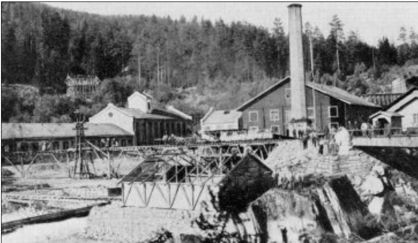
Tinfos Papirfabrik og arbeidsstokken ved Notodden, ca. 1884. (Hansen 1963)

slike sammenhenger. Arbeidet var helsefarlig, og verket hadde egen doktor. 30 Men fallende kobberpriser førte til at driften ble kraftig redusert i 1890-årene, og fra 1888 til 1893 gikk arbeidsstokken ned fra 313 til 101 arbeidere. 31