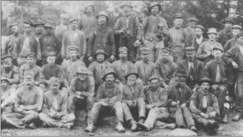
Gruvearbeidere ved Åmdal Verk i Vest-Telemark i 1904 (Grimdalen 1996)

slike sammenhenger. Arbeidet var helsefarlig, og verket hadde egen doktor. 30 Men fallende kobberpriser førte til at driften ble kraftig redusert i 1890-årene, og fra 1888 til 1893 gikk arbeidsstokken ned fra 313 til 101 arbeidere. 31