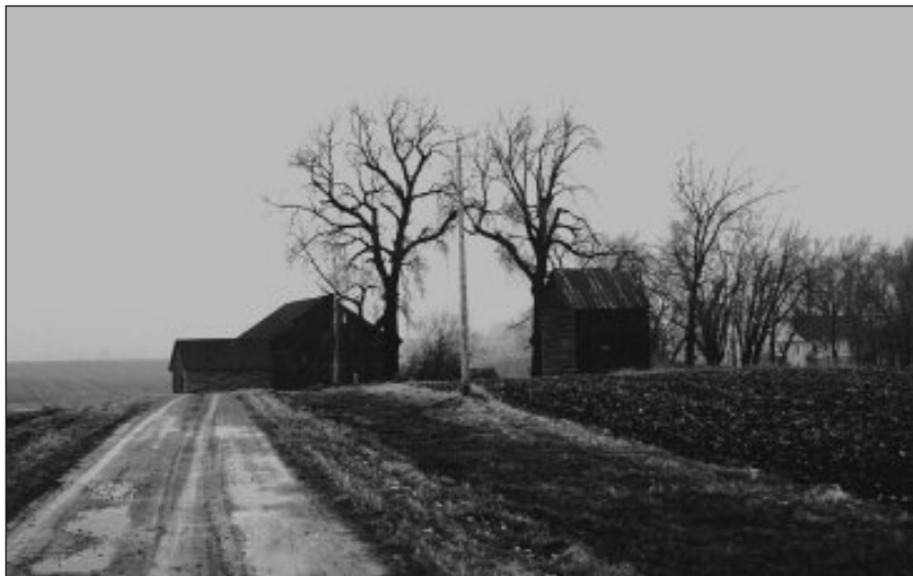
Ensomt på prærien ligger farmen der familien Veblen bodde, nær Nerstrand i Minnesota.