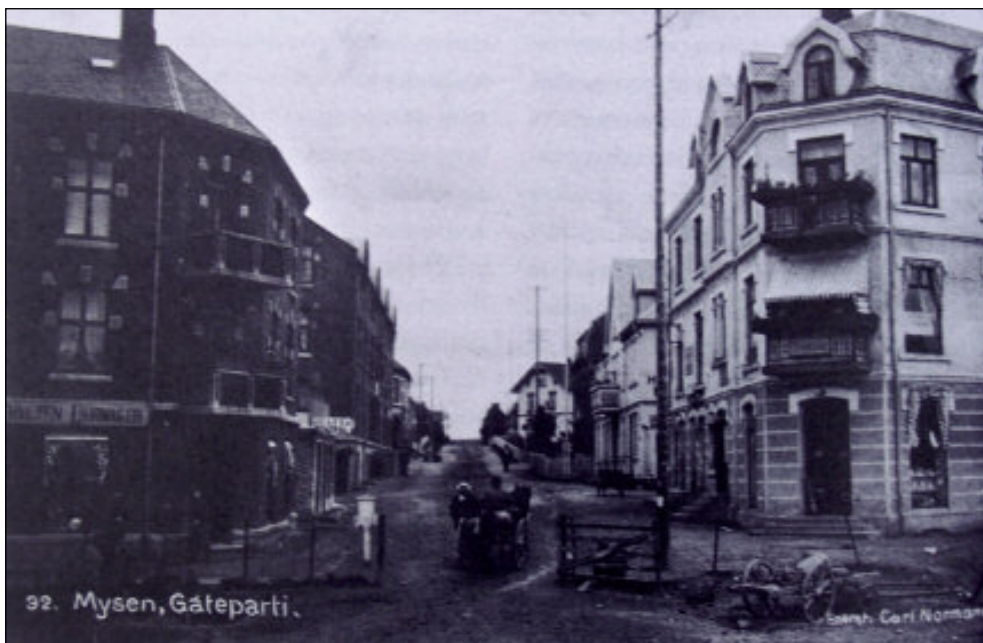
Urbane ambisjoner: Mysen 1916.

lig, materiell nød på grunn av handelsblokaden. Hendingene i 1814 medførte ikke den oppgangen man hadde håpet på. Det ble slutt for mange av de store og mektige familienes handelshus, og pengereformer tok kvelertak på folk som slet med renter og avdrag.