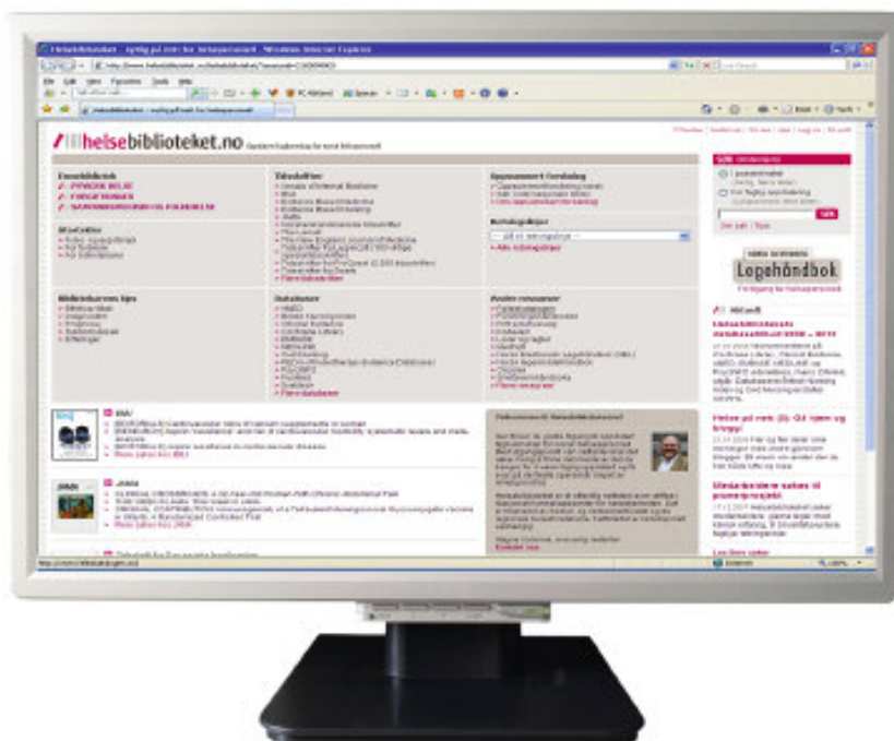
Figur 1. Tradisjonelle bibliotekjenester som tidsskrifter og databaser dominerer innholdet på Helsebiblioteket, som også gir enkel tilgang til oppsummert forskning, retningslinjer og beslutningsstøtteverktøy.