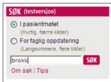
Figur 2. Det kan velges mellom to søkealternativer; et søk i få kilder som gir enkle og raske svar til bruk i pasientmøtet og et mer omfattende søk i flere kilder til bruk ved mer generell faglig oppdatering.

En av de største utfordringene i kunnskapsformidling er å lage systemer som gjør det mulig å nyttiggjøre seg kvalitetssikret kunnskap på en enkel måte. Kunnskapen må være brukervennlig; kortfattet, enkel og levert i en form som kan benyttes på en vanlig arbeidsdag. Med andre ord må den foredles. Brian Haynes beskriver et slags foredlingshierarki av kunnskap i