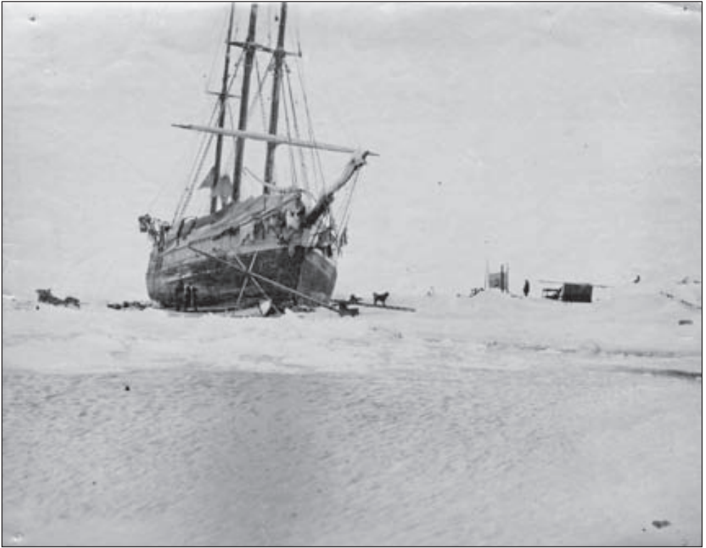
Figur 3. «Fram» i isen, antakelig like før båten kom seg løs sommeren 1896.