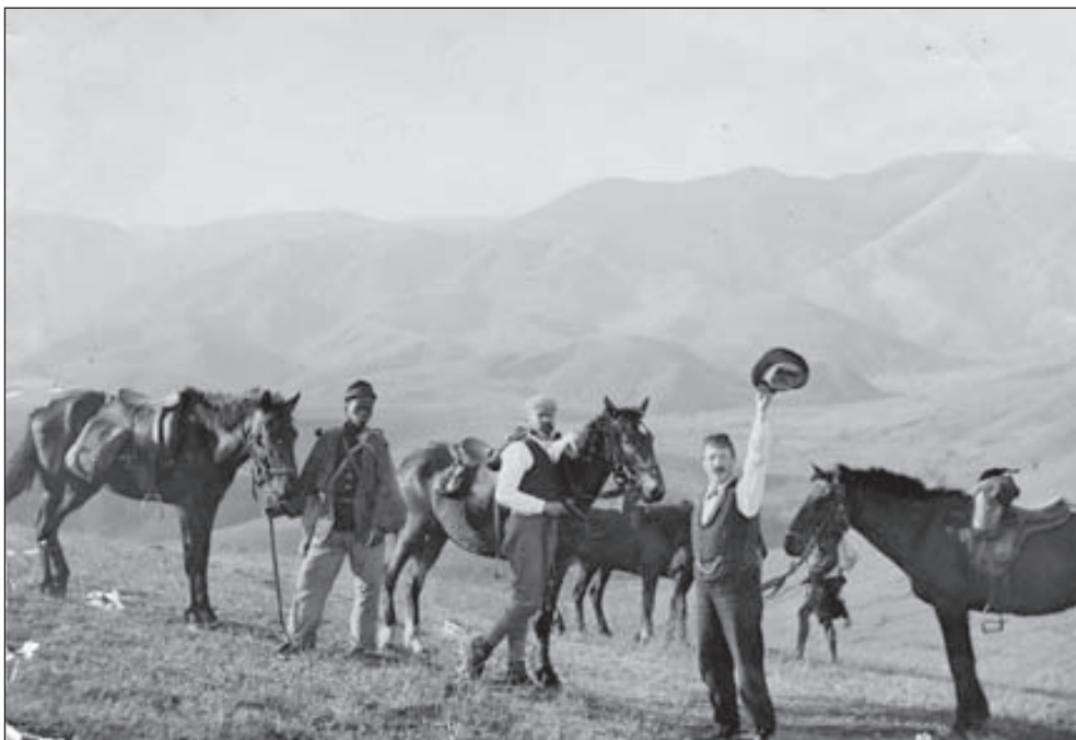
Figur 10. Fra Zulu-Natal-provinsen i Afrika.