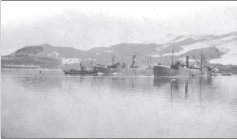
Figur 12. Hvalfangst i Sydishavet.

i boken «En Hvalfangerfærd» 19 . Han var nemlig lege om bord i samme hvalkokeri som Blessing, seks år senere.