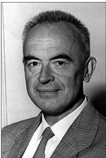
Karl Evang, ca. 50 år