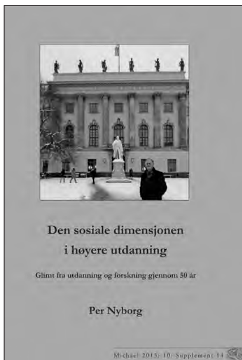
Figur 1: Per Nyborgs bok, Michaels supplement 14 fra 2013.