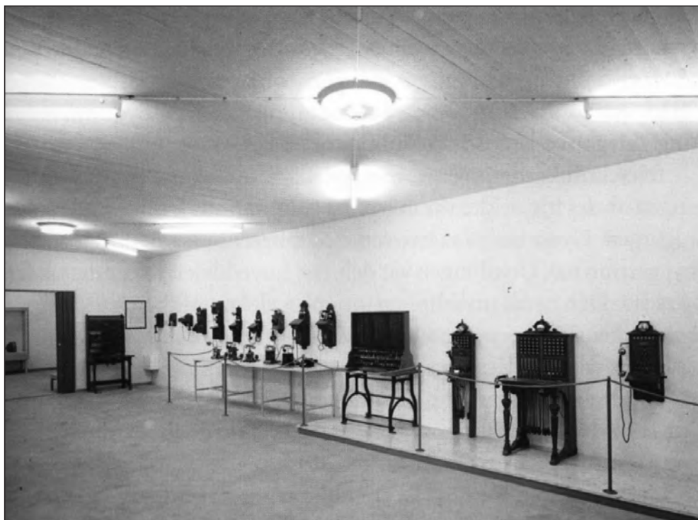
Utstilling på Helsefyrt. Telefonapparater og telefonsentraler i kontekstløs rekke.

oftest kronologisk oppstilte objekter tatt ut av sin virkelighet, bare med sparsom ledsagende informasjon.