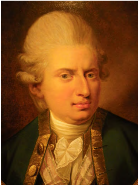
Figur 1: Johann Friederich Struensee (1737–1772), portrettert i 1771 av Jens Juel (1745–1802).

med bakgrunn i tidens viten. Veiersted (6) analyserer dette nærmere i en artikkel som er basert på avhandlingen.