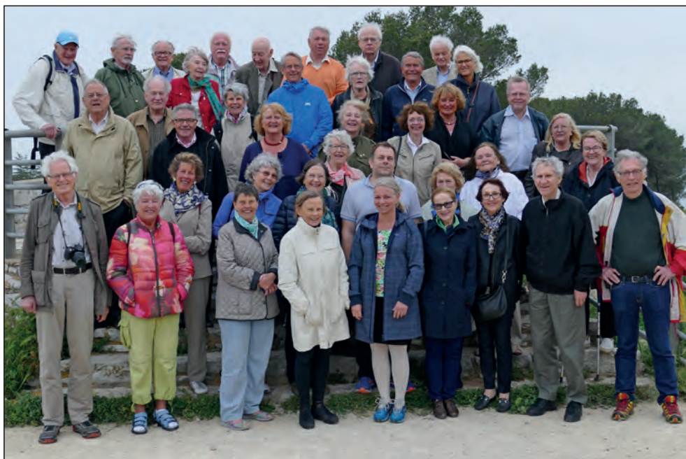
Figur 7: Medlemmer av Stiftelsen Nasjonalt Medisinsk Museum og av Det norske medicinske Selskab på utflukt til Syd-Frankrike i april 2015.