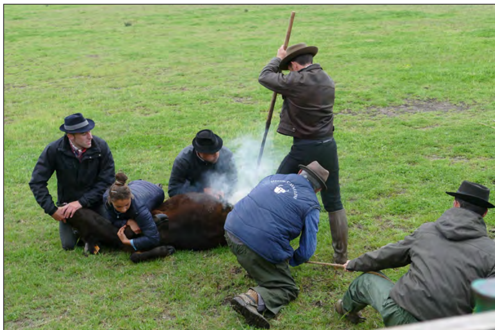
Figur 8: Ved det omfattende sosiale programmet under ekskursjonen til Frankrike var det også lagt inn en noe spesiell utfukt til en gård der man brennemerket kalver og klipte merker i ørene på dem under remjing, rauting, hyl og skrik. Det ble sagt blant deltakerne at det for deres skyld ikke var nødvendig med underholdning i form av dyreplageri.

Selskabets sterke og svake sider samt dets potensial, har ligget til grunn. Dette arbeidet videreføres.