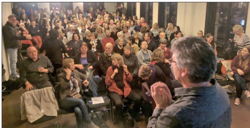
Figur 6: Overfylt, åpent møte 18. mars 2015 i Litteraturhuset, Oslo, om cochleaimplantasjon, arrangert av Stiftelsen Nasjonalt Medisinsk Museum med Det norske medicinske Selskaps medlemmer som inviterte deltakere.