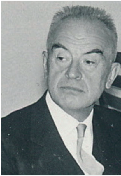
Figur 3: Evangs sarkasmer kunne være bitende, men ofte «to the point».

pliktende slik definisjon er et politisk verktøy. Den trekker en lang rekke forhold inn i den medisinske sfære. Spesielt gjelder dette helseskadelige sosiale forhold som det nå blir et medisinsk anliggende å gjøre noe med. Og sosial elendighet var det nok av i verden i etterkrigsårene. WHO's vedtak om en ny helsedefinisjon gjorde at medisinsens etikk og verdigrunnlag fra da av også gjaldt forhold som tidligere lå utenfor.