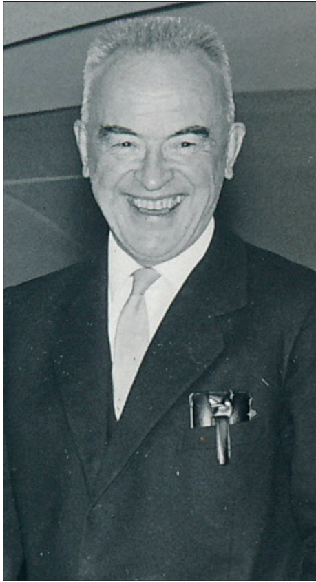
Figur 1: Karl Evang

Befolkningspolitikk var blant de temaene som var særlig aktuelle i mellomkrigstiden, også i Mot Dag . Familieplanlegging og seksuell opplysning var da et viktig arbeidsområde, spesielt i et samfunn der det var lite åpenhet om slike temaer. Evang vakte furore med sin innsats, og hans tidsskrift Populært tidsskrift for seksuell opplysning som kom ut fra 1932, fikk stor utbredelse og ble lest i døgsmål av mange ungdommer i hjem der man ikke snakket om denslags.