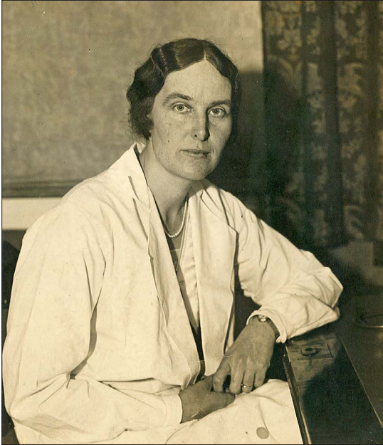
Figur 1. Tove Mohr (1891–1981) var lege og arbeidet i likhet med sin mor, Katti Anker Møller, for mødrehygiene og abortsak. Forfatterne henter mye fra Mohrs biografi om moren fra 1968. Fotografi trolig fra 1930-årene.

ut mot søsteren og støttet flertallets lovforslag. Det er pussig at forfatterne ikke følger abortsaken etter 1918, særlig med henblikk på deres vektlegging av familieforhold.